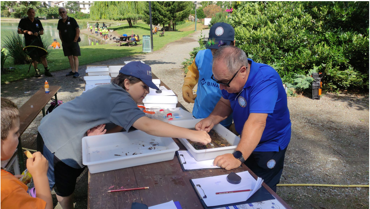
i ragazzi intenti nella classificazione degli insetti recuperati

clicca sul link per visualizzare le foto di una giornata didattica con le scuole: https://www.facebook.com/groups/laghetto grosotto/permalink/10159767036512286/