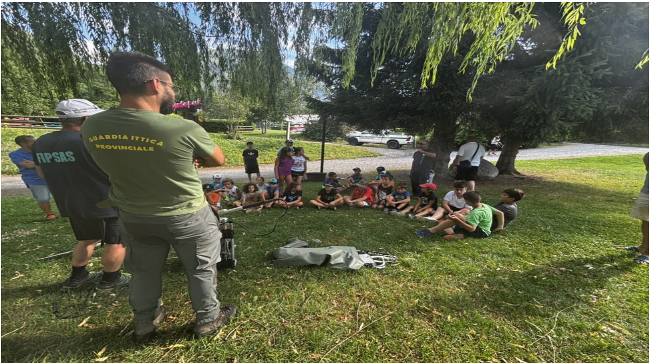
le guardie Ups spiegano ai ragazzi le fasi dell'elettropesca