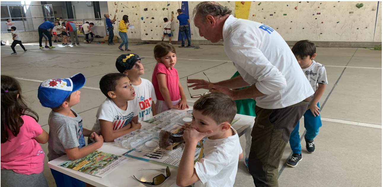
lezioni ambientali in palestra (giornata dello sport Tirano 2024)

Al fine di ottimizzare ed eventualmente adottare nuove iniziative o modifiche al nostro lavoro nell'ottica di perseguire un continuo miglioramento a livello organizzativo ma anche di rapporto tra "istruttore e allievi", durante ciascun evento verrà consegnato ad ogni partecipante un piccolo questionario di seguito riportato che dovrà essere riconsegnato opportunamente compilato al termine del percorso intrapreso.