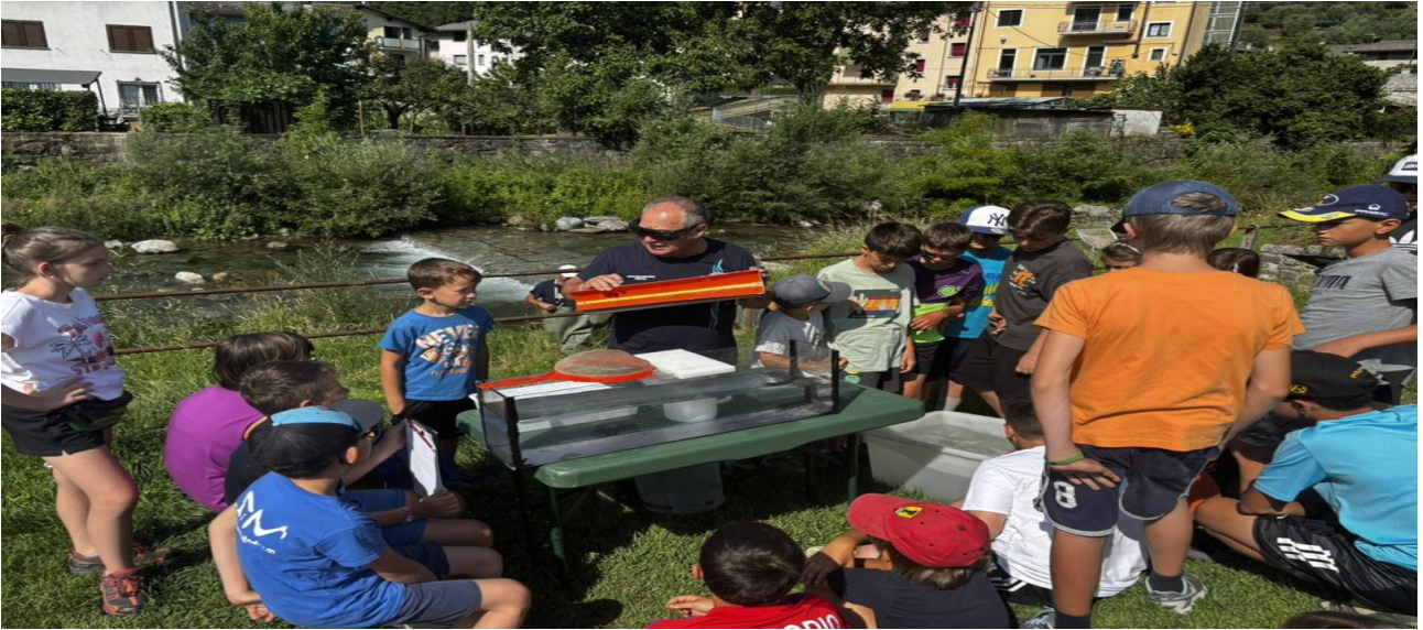
incontro con personale della protezione civile ai ragazzi dei campi estivi

Nelle foto seguenti alcuni momenti salienti delle attività effettuate negli ultimi due anni: