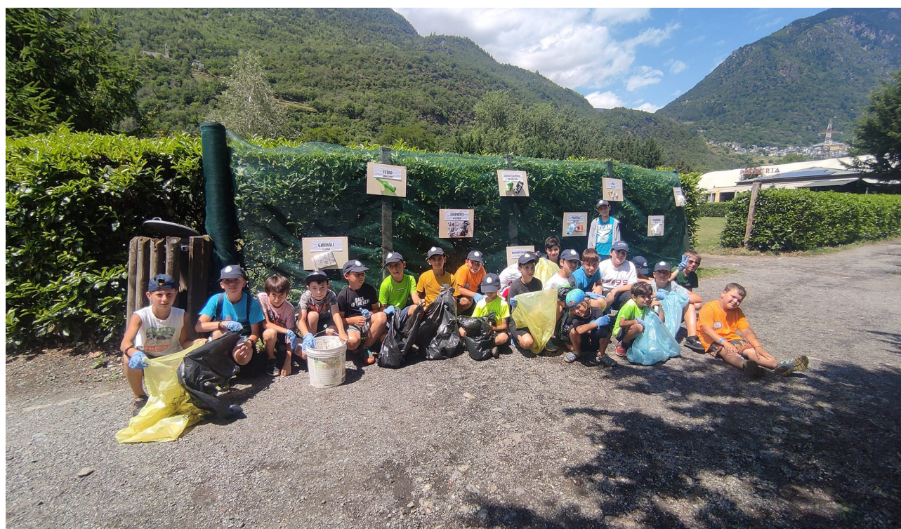
di rientro dal pomeriggio ecologico davanti al pannello rifiuti