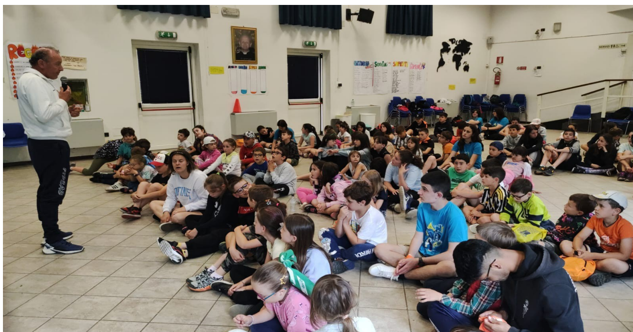
Incontri in palestra per la presentazione teorica