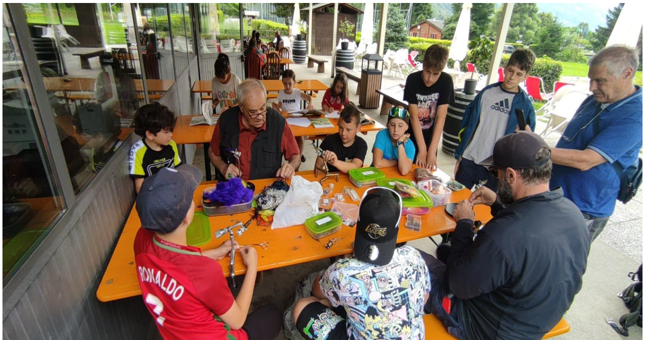
laboratorio di costruzione di mosche artificiali utilizzando materiali di recupero