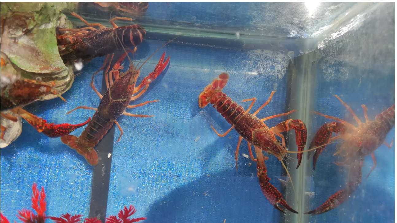
lezione sui gamberi con acquario portatile