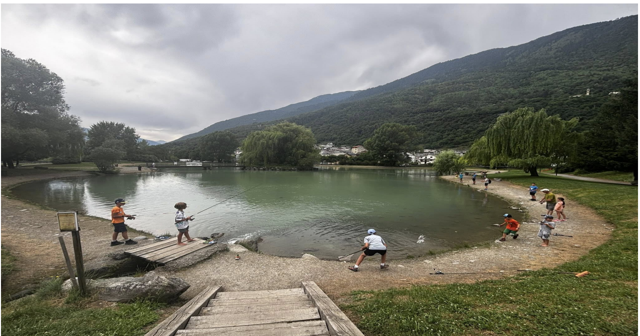
un momento di pesca dei ragazzi nell'attività di pesca

Alternare le attività didattiche alle attività sportive (pesca sportiva, lancio tecnico e pesca magnetica) è indispensabile per mantenere alta l'attenzione dei ragazzi sulle varie attività in programma.