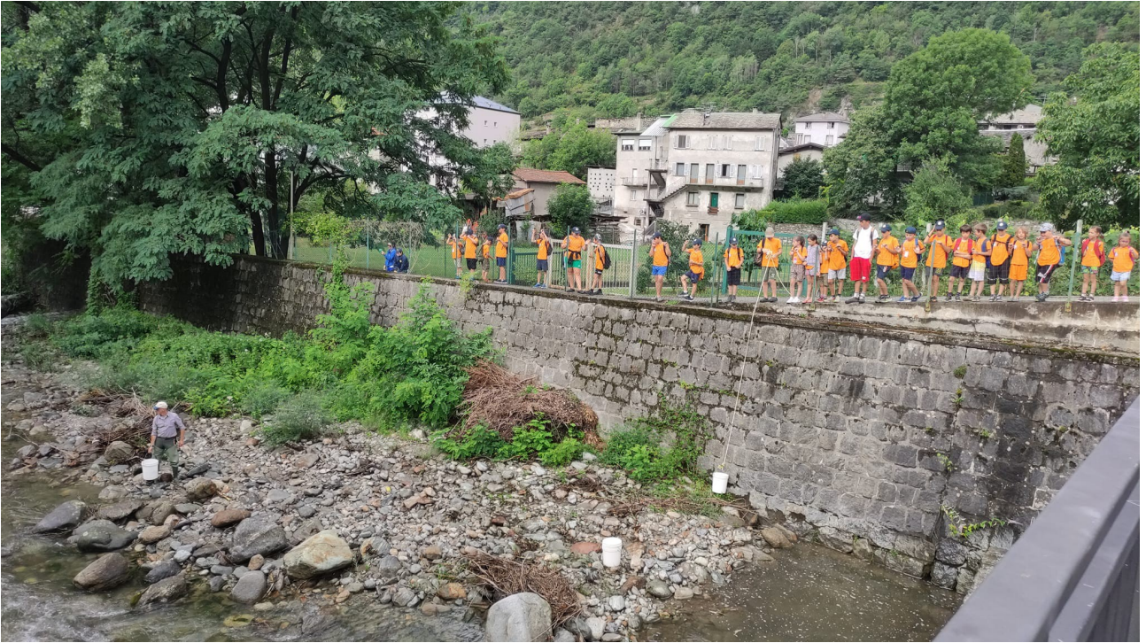
a scuola di guardiapescia: si osserva da vicino il lavoro delle guardie