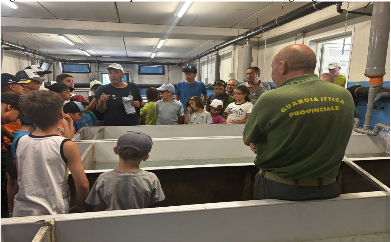
Nelle foto sopra e sotto: i ragazzi in visita al centro ittico e impegnati nella costruzione di mosche artificiali

Al fine di monitorare ed eventualmente migliorare i corsi, durante lo svolgimento i ragazzi saranno tenuti a compilare una serie di schede relative agli argomenti trattati.