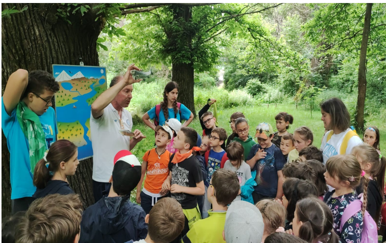
spiegazione degli ambienti acquatici su lavagna magnetica ad un grest (lezione fatta direttamente in un bosco in riva ad un torrente locale)

Con la partecipazione dei guardiapesca si procederà, dopo attenta spiegazione, la semina di trotelle autoctone proveniente dal centro ittiogenico di Faedo. Ogni ragazzo avrà modo di immettere le piccole trote nell'ambiente naturale.