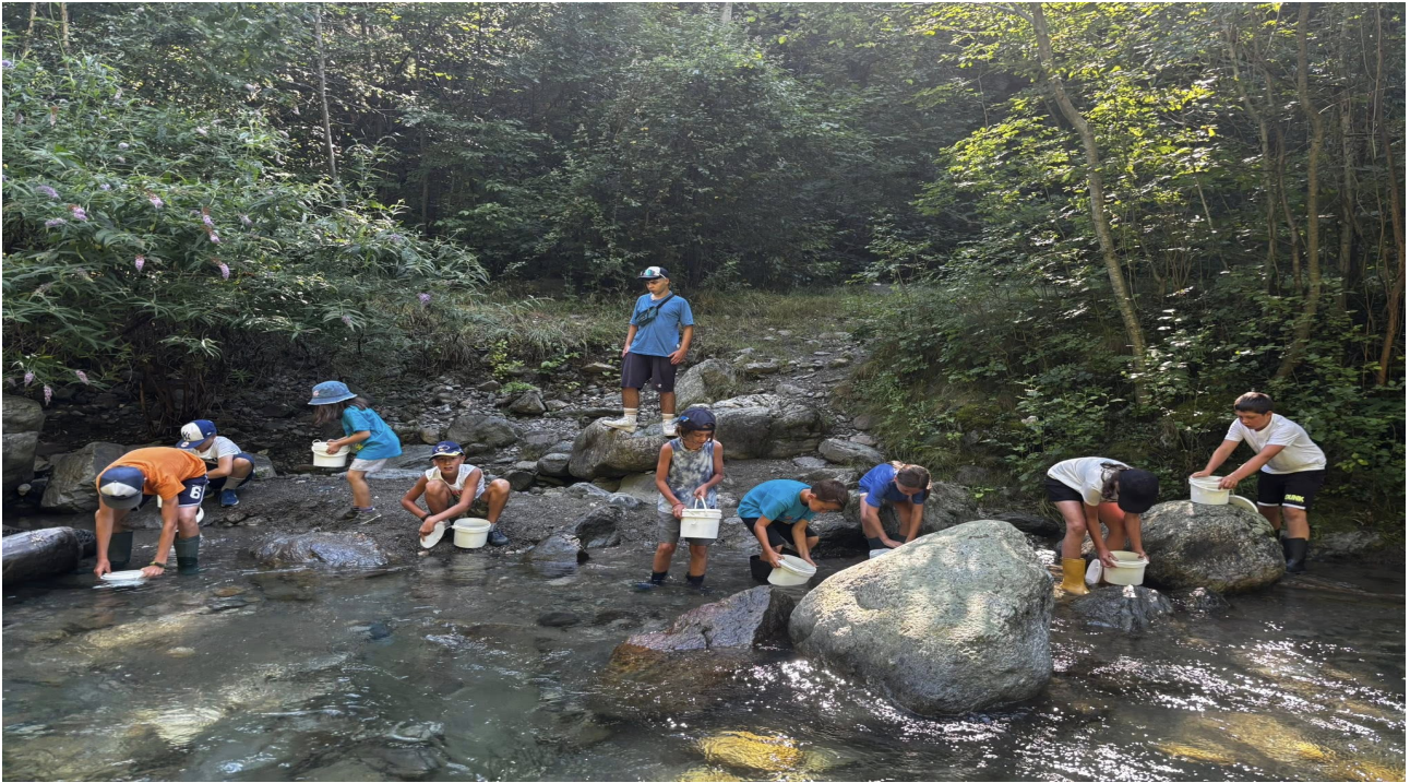
ricerca sul campo degli insetti acquatici con una classe scolastica