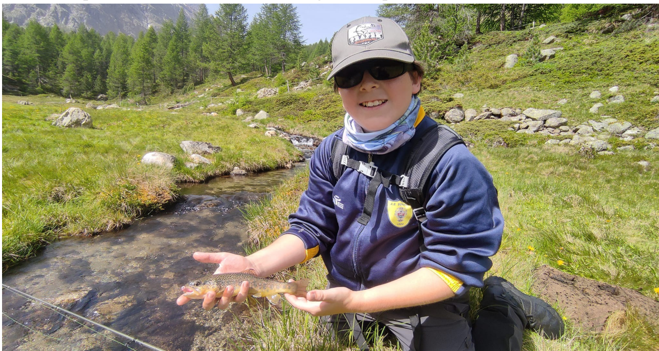
Nelle foto sopra e sotto: due uscite sui torrenti alpini con due ragazzi accompagnati da guide specializzate

passaggio a nostro parere, è molto importante, in quanto ci consentirà di verificare se le nozioni e le informazioni proposte siano state condivise e recepite. Prevista anche scheda di giornata per la rendicontazione dell'attività.